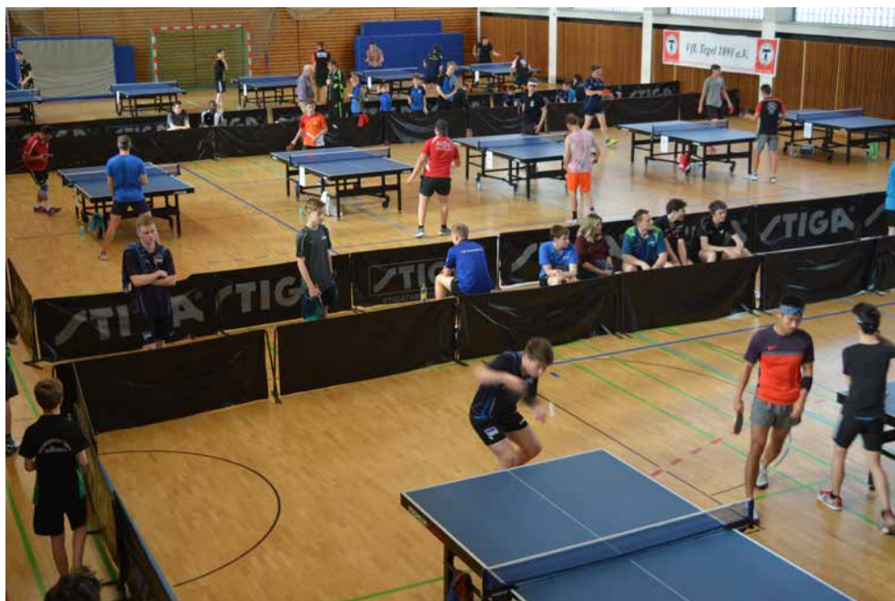
„TT Tegel Open“ im Sportpalast Tegel Berlin-Brandenburgs größtes Breitensport TT-Turnier; ein Foto aus besseren Tagen