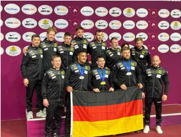
DRB Ringer und Trainerstab

Als einer der jüngsten Sportlerinnen der EM eine Medaille zu holen, ist eine grandiose Leistung.